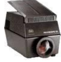
الجهاز المعتم او الفانوس السحري السلادات