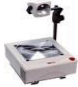
جهاز العرض العلوي